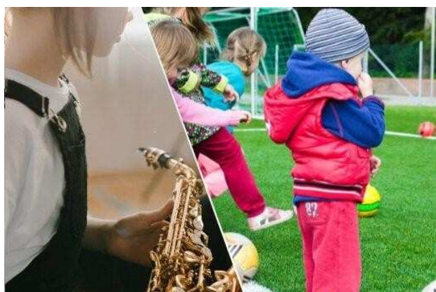
L’immagine della locandina della fase 2 del bando-progetto ‘La Scuola, il nostro futuro’

Prosegue il progetto promosso dalla Caritas diocesana di Perugia-Città della Pieve, un aiuto concreto rivolto a studenti e famiglie in difficoltà a seguito della crisi causata dall’emergenza Covid-19